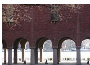
ストックホルム市庁舎の中庭から湖をみる