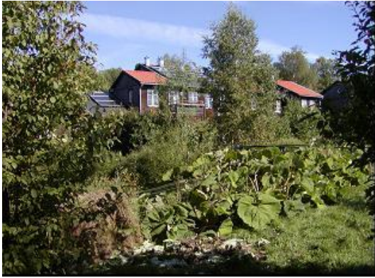
▲エコビレッジにはソーラーパネルが設置され、手前にはビオトープと菜園もあります。