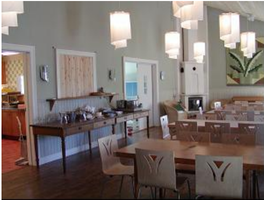
▲共用部分の食堂とホール左が厨房で奥が子供の遊び場になっており、住民の居間のような使い方がなされています