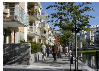
ハンマルビーの遊歩道は雨水利用の水路とグリーン広場で構成