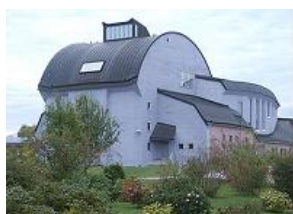
ヤーナのカルチャーハウス