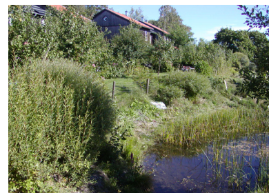
エコビレッジはソーラーパネルやビオトープなどが見られる