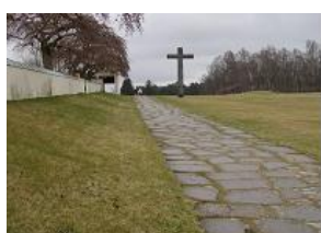
世界遺産に登録されている森の葬祭場